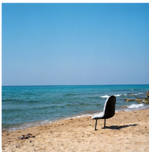
Αγγελική Σβωρόνου, A chair with a view