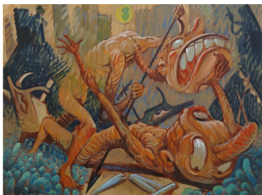
Ιάκωβος Βάης, Αιτίλο