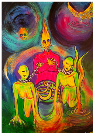
Γεωργία Καλογεροπούλου, Νερό και Γη, Φωτιά και Αέρας