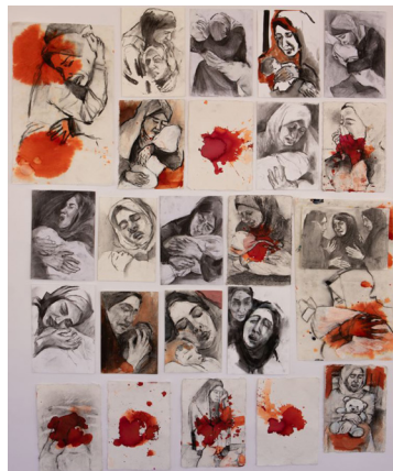
Κατερίνα Καλαντζίδου, Μάνες της Γάζας