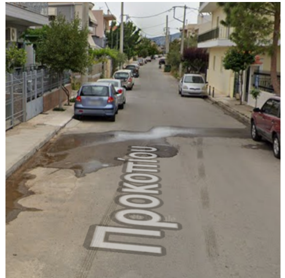
Εικόνα 2 : Άποψη των οδών Αμαλιάδος και Προκοπίου

Η συνολική κυκλοφοριακή αντιμετώπιση της περιοχής οφείλει να ενταχθεί σε ένα ευρύτερο πλαίσιο ολοκληρωμένης μελέτης ανά πολεοδομική ενότητα, η οποία θα εξετάζει συστηματικά τα ιδιαίτερα προβλήματα κάθε περιοχής, όπως έχει διαπιστωθεί και στην ΠΕ «Αγριλέζα». Τα προβλήματα αυτά περιλαμβάνουν: ανεπαρκή γεωμετρικά χαρακτηριστικά οδών, αδιέξοδα, μη υλοποιημένες ρυμοτομίες, ύπαρξη ρεμάτων, βιομηχανικών εγκαταστάσεων, σχολικών μονάδων κ.λπ.