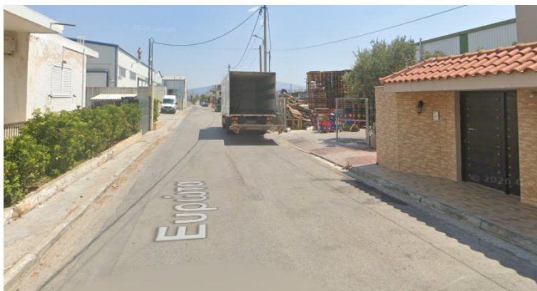
Εικόνα1. Άποψη της οδού Ευρώτα

Με την με αρ. πρωτ. 12550/02-03-2026 αίτηση των κατοίκων της οδού Ευρώτα (βλ. συνημμένη αίτηση), ζητείται η εφαρμογή κυκλοφοριακής ρύθμισης μονοδρόμησης, με σκοπό τη βελτίωση του επιπέδου οδικής ασφάλειας. Η υφιστάμενη αμφίδρομη λειτουργία της οδού κρίνεται ανεπαρκής και δυνητικά επικίνδυνη, λόγω των περιορισμένων γεωμετρικών χαρακτηριστικών της και των μικτών χρήσεων γης που εξυπηρετεί (κατοικίες, βιοτεχνικές εγκαταστάσεις, αποθήκες), οι οποίες συνεπάγονται αυξημένη κυκλοφοριακή φόρτιση και διέλευση βαρέων οχημάτων.