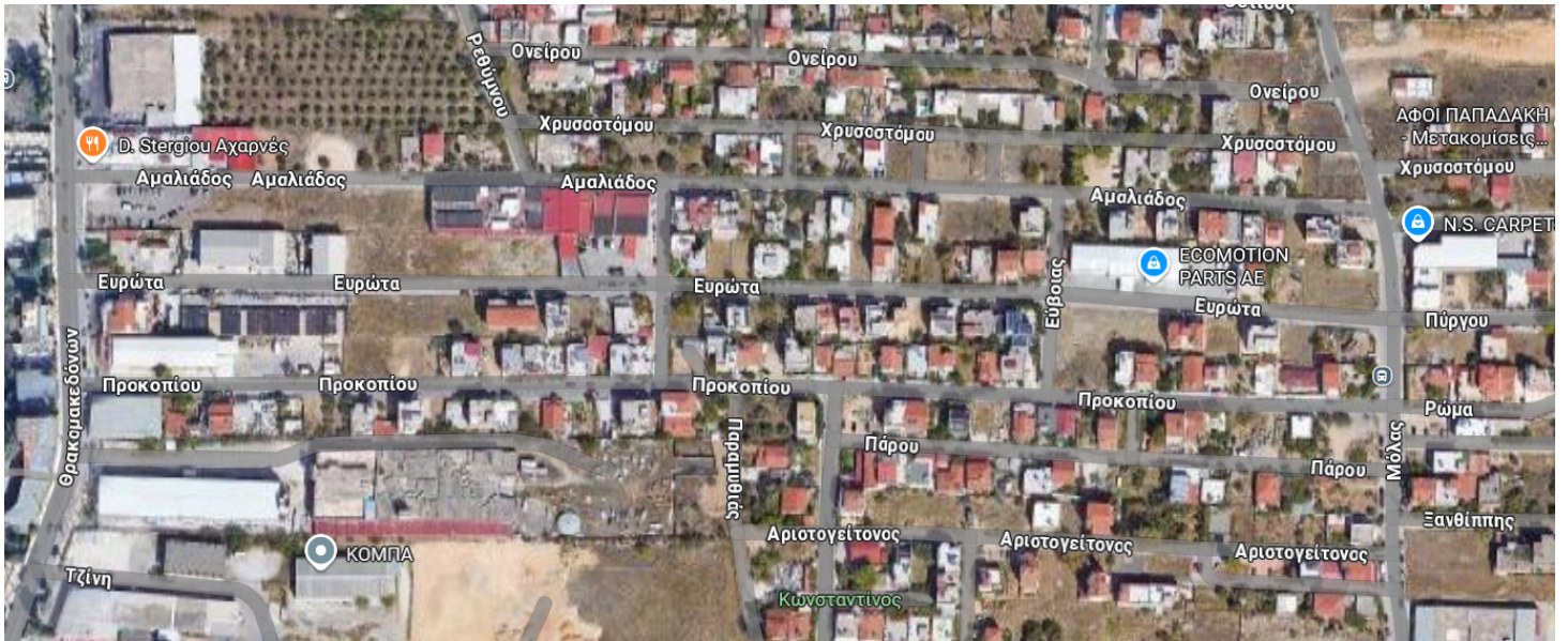
Εικόνα 3 : περιοχή μελέτης